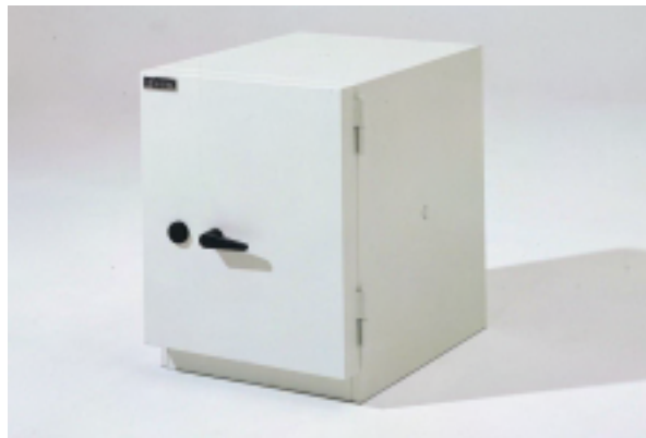
Schnappverschluss mit DSS