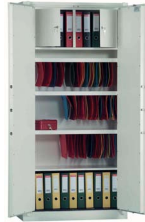
Art.38004 mit 3x 38024 + 38029 gg. Aufpreis