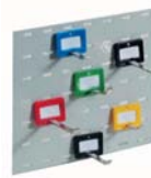
neues Hakensystem in unterschiedlichen Längen