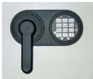
Art. Nr.: 38021 + Art. Nr.: 38022