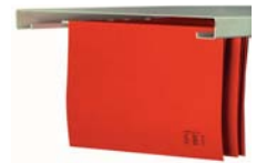
Art. 38024 (unter FB recht+links einhängbar)

Sonder- Maße u. Ausführungen gg. Mehrpreis lieferbar - Berechnungsgrundlage s. Seite 1 der Preislisten ! Leistungsmerkmale mech. Zahlen- und Elektronikschlösser s. Sonderseiten Schlösser und Beschläge !