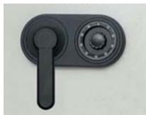
Art. Nr.: 38020