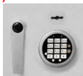
alternativ DB+DFS Art. Nr.: 55420