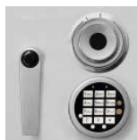
alternativ ZK+DFS Art.Nr.: 55421 Art.Nr.: 55422 Art.Nr.: 55431