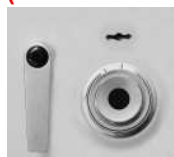
Hängegriff DB+ZK Metall standard