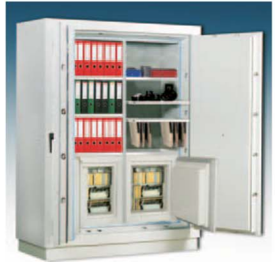
Art.-Nr. 46008 mit 2 x 46033 auf Boden links und rechts von Trennwand und 46025 u. 46027 gg. Aufpreis

Versicherungsschutz durch definierte Einbruchprüfung nach VdS 2450/EN 1143-1 Klasse 1, privat bis € 65.000,-; gewerblich bis € 20.000,- (bei fach- und sachgemäßer Verankerung gem. beigefügter Anleitung) Feuerschutz durch Brandprüfung nach EN 1047-1 Güteklasse S 120 P. Zertifiziert und güteüberwacht durch VdS-Zert in Köln. Korpus und Tür mehrwandig. Tür 134 mm stark, mit allseitiger Bolzenverriegelung. Durch spezielle Füllungen und Dichtungen sind darin aufbewahrte Dokumente, Akten, Geld etc. optimal vor Bränden und Löschwasser geschützt. Die Schränke wurden an der TU Braunschweig einer Feuerwiderstands- und Sturzprüfung, Dauer 2 Stunden, bis 1090°C, unterzogen. Der Test wurde erfolgreich abgeschlossen. Verriegelung über Doppelbartschloss. (incl. zwei Schlüsseln). Serienmäßig zur Bodenverankerung vorgesehen. Beschläge/Scharniere 60 mm vorstehend. Lackierung: RAL 7035