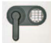
Art.-Nr.: 46021+ 46022