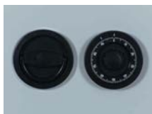
Art. Nr.: 36220