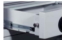
Schublade gepanzert auf Teleskopschienen laufend