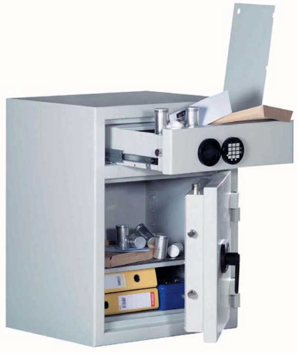
Abb. Art.-Nr. 36200 Haupttür und Schublade mit Elo-Schloss gg. Mehrpreis