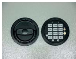
Art. Nr.: 36021+ Art. Nr.: 36022