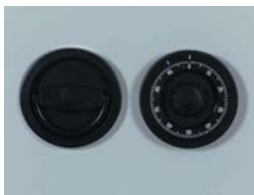
Art. Nr.: 36020