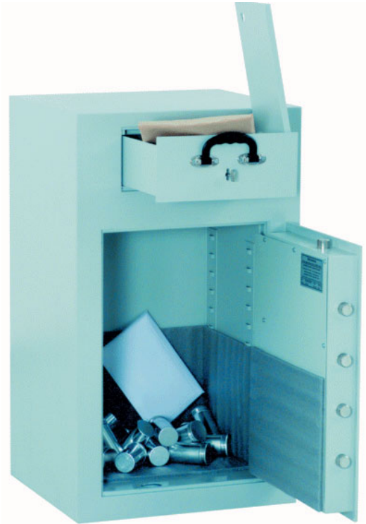
Alle Abb. Art.-Nr. 36001 mit DB-Standardschloss