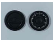
Art. Nr.: 36320