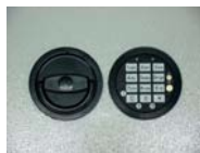
Art. Nr.: 36321+Art. Nr.: 36322