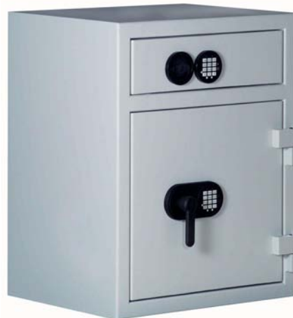
Art.-Nr. 36300 geschlossen mit Elo GST S plus für Tür und Schublade gg. Aufpreis