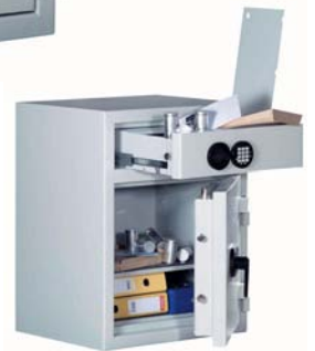
Art.-Nr. 36300 geöffnet