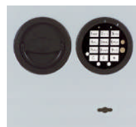
DFS Schloß mit mechanischer Revision Art. Nr. 59287