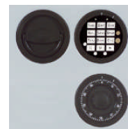
DFS Schloß mit mechanischer Revision Art. Nr. 59288