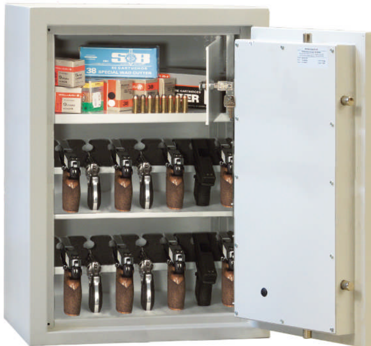
Art. Nr. 59272

Versicherungsschutz durch definierte Einbruchprüfung nach PN-EN 1143-1 Klasse N/0I priv. bis € 40.000,-gewerblich bis € 10.000,-(bei fach- u. sachgemäßer Verankerung gem. beigefügter Anleitung). Der Einbau von EMA-Komponenten (doppelte Versicherungssumme) ist gg. Aufpreis möglich (Sprechen Sie mit Ihrer Versicherung). Allseitig mehrwandiger Korpus mit mehrwandiger Tür 83 mm stark. Die Konstruktion garantiert einen definierten Einbruchschutz gegen Angriffe mit mechanischen und thermisch wirkenden Einbruchwerkzeugen. (Einbruchschutz 30/30 RU). Serienmäßig 1 Bohrung im Boden für Verankerung. Die Verriegelung erfolgt über DB-Schloß der Schloß Kl. I. (incl. zwei Schlüssel). 3-seitige Verriegelung über Klappgriff 12 mm vorstehend. Tür mit Hintergreifprofil. Waffenhalter aus Schaumstoff auf Boden und Fachboden. Modelle 59272 und 59273 mit separatem Innenfach mit Zyl.-Schloß