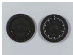
ZK Schloß Art. Nr.: 59280