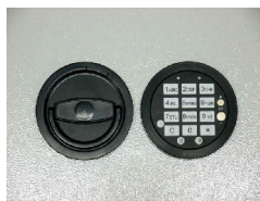
DFS Schloß Art. Nr.: 59281, 59282 und 59283