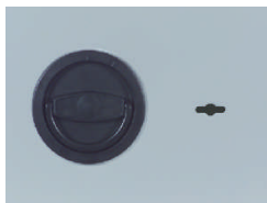
Klappgriff Kunststoff schwarz - standard

Standardlackierung: RAL 7035 grau bzw. RAL 6020 grün (Bitte bei der Bestellung angeben!)