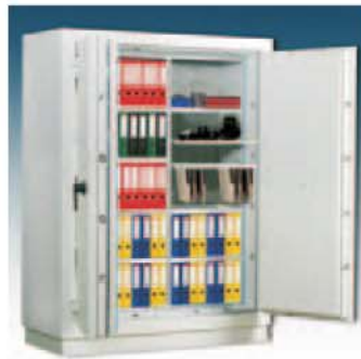
Art. Nr.:45008 + 45025+45026