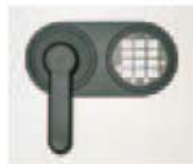
Art.-Nr.: 45021+ 45022