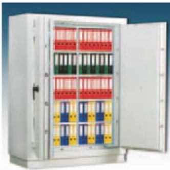
Art.-Nr. 45008 (bis zu 105 DIN A 4 - Ordner möglich !)