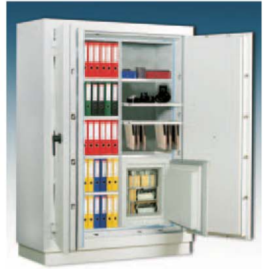
Art.-Nr. 45008 mit 45033 und 45025 + 45027 gg. Aufpreis

Feuerschutz: Durch Brandprüfung nach EN 1047-1 Güteklasse S 120 P .Zertifiziert und güteüberwacht durch VdS-Zert. Korpus und Tür mehrwandig. Tür 134 mm stark, mit allseitiger Bolzenverriegelung. Durch spezielle Füllungen und Dichtungen sind darin aufbewahrte Dokumente, Akten, Geld etc. optimal vor Bränden und Löschwasser geschützt. Die Schränke wurden an der TU Braunschweig einer Feuerwiderstands- und Sturzprüfung, Dauer 2 Stunden, bis 1090°C, unterzogen. Der Test wurde erfolgreich abgeschlossen. Verriegelung über Doppelbartsicherheitschloss (incl. zwei Schlüsseln). Beschläge und Scharniere 60 mm vorstehend . (incl. zwei Schlüsseln). Serienmäßig zur Bodenverankerung vorgesehen. Lackierung: RAL 7035