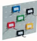
Art. 35129 - 31 + 35 Schlüsselhaken