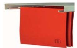
Fachböden f. Hängeregister (unter Fachboden links + rechts einhängbar)