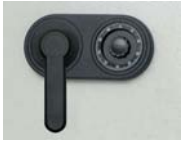
Art. Nr.: 35120