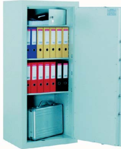
Art.-Nr. 35108 und 35123 mit DB-Standardschloss

Priv. bis € 40.000, gew. bis € 10.000 durch Ausführung nach VDMA 24992 Sicherheitsstufe B Ausgabe Mai 95. Allseitig doppelwandiger Korpus. Tür doppelwandig 80 mm stark mit vierseitiger Verriegelung durch Schliessbolzen mit 25 mm Durchmesser. Hochwertige Feuerisolierung, umlaufender Feuerfalz. Auf Wunsch wird auch ein Innentresor eingeschweißt (gegen Mehrpreis). Standardverriegelung über Doppelbartsicherheitsschloss (incl. zwei Schlüsseln), oder gegen Mehrpreis mit mechanischem Zahlenschloss bzw. Elektronikschloss. Lackierung: RAL 7035 grau