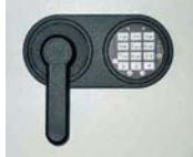
Art. Nr.: 35121 +Art. Nr.: 35122