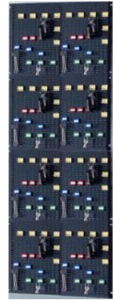
Art. 35131 Schlüsselhakensystem f. TV-Blech

Sonder- Maße u. Ausführungen gg. Mehrpreis lieferbar - Berechnungsgrundlage s. Seite 1 der Preislisten ! Leistungsmerkmale mech. Zahlen- und Elektronikschlösser s. Sonderseiten Schlösser und Beschläge !