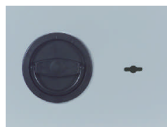
Clappgriff DB Standard