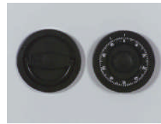
Mech. ZK Schloss Art. Nr.: 59420