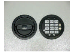
DFS Schloss Art. Nr.: 59421 Art. Nr.: 59422 Art. Nr.: 59432