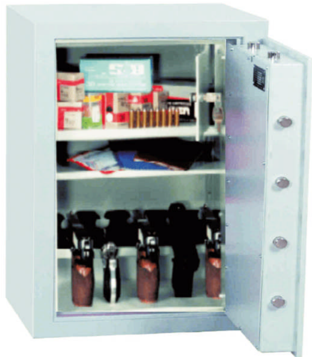
Abb.: Art. Nr. 59403 und Innentresor Art.Nr. 59423 gg. Mehrpreis

Sonderlackierung gegen Aufpreis möglich!