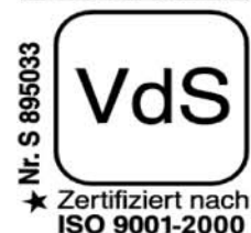
Abbildung NSTS 3/3