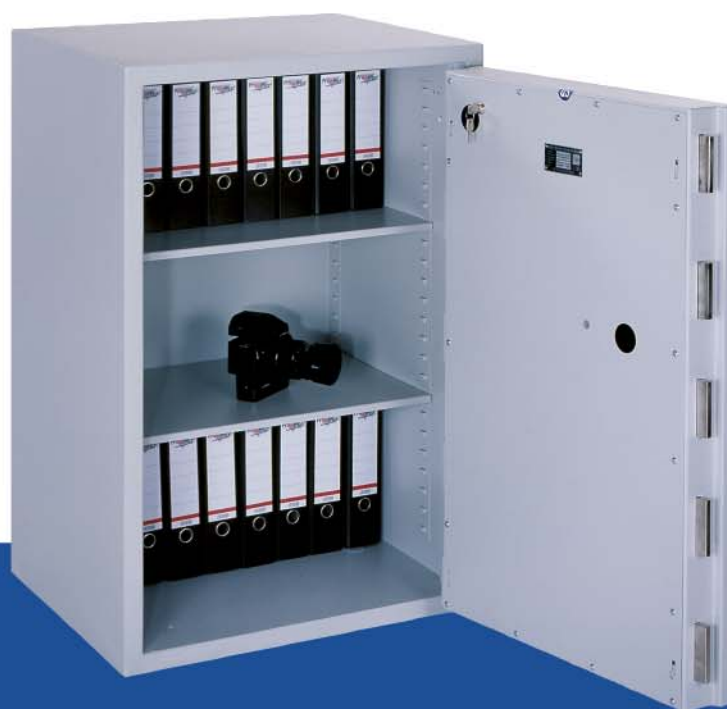
Abbildung Pegasus 375