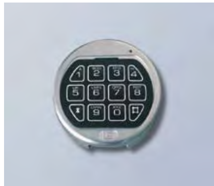
Elektronisches ZKS La Gard Basic.