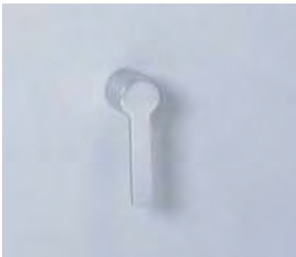
DSS mit Hängegriff.