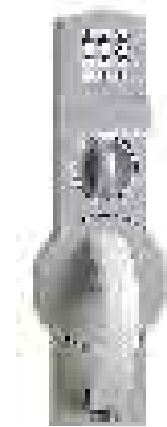
Grundmodul mit Zahlenkombinationsschloß, elektronisch (Code-Combi-B mit Revisionschlüssel)