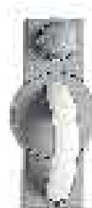
Grundmodul mit Zahlenkombinationsschloß, mechanisch