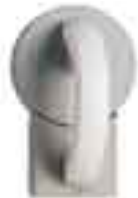
Grundmodul mit Doppelbart-Sicherheitsschloß

hierzu erhalten Sie im Katalogregister 8 – Griffe und Verschlussvarianten.