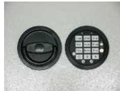
DFS Schloß Art. Nr.: 59021 Art. Nr.: 59022 Art. Nr.: 59026

Sonder- Maße u. Ausführungen gegen Mehrpreis lieferbar