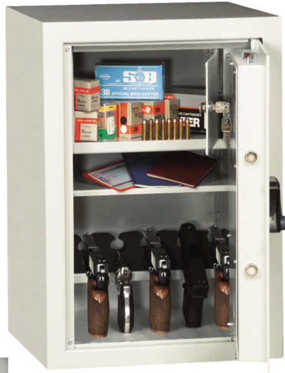
Abb.Art.-Nr.59004 m. Schloß Art.-Nr. 59021, Innentresor Art.-Nr.59023 und Fachboden Art.-Nr.59024 gg. Mehrpreis

Sonderlackierung gegen Aufpreis möglich!