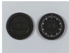
Mech. ZK Schloß Art. Nr.: 59020