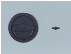
Klappgriff DB Standard