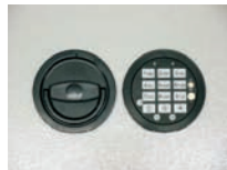
Abb. DFS Schloss Art. Nr.: 52521 Art. Nr.: 52522 Art. Nr.: 52533