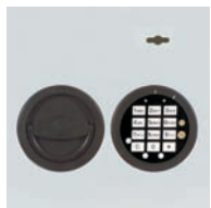
DFS Schloss mit 52534