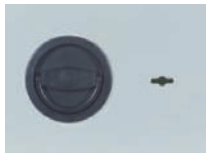
Klappgriff DB Standard