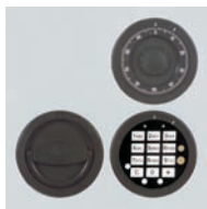
DFS Schloss mit 52535