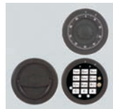
DFS Schloss mit 51535