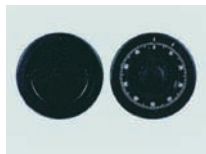
Art. Nr.: 51520