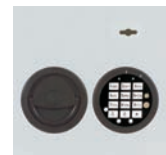
DFS Schloss mit 51534