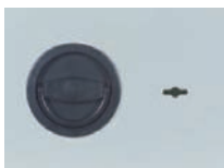
Klappgriff DB Standard