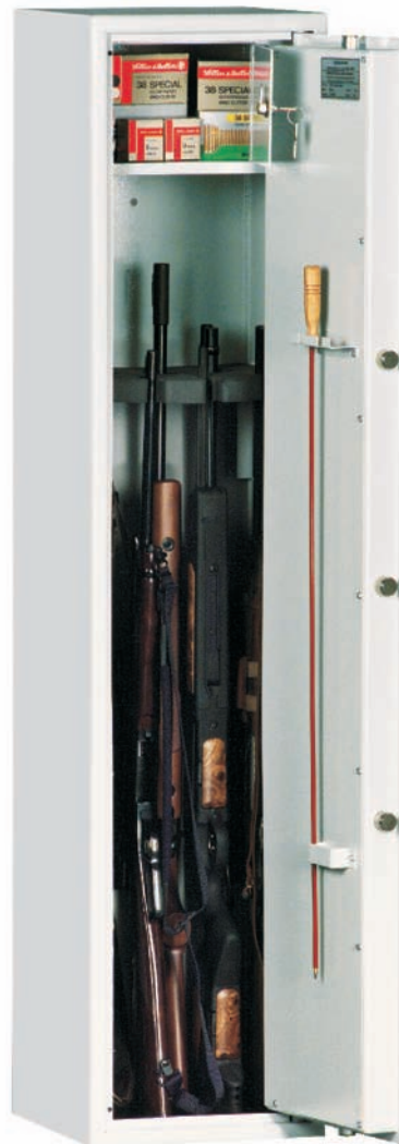
Abb.: Art.-Nr. 50002 mit DB-Schloss (Standard)

RAL 7035 grau bzw. RAL 6020 grün (bitte bei der Bestellung angeben!)