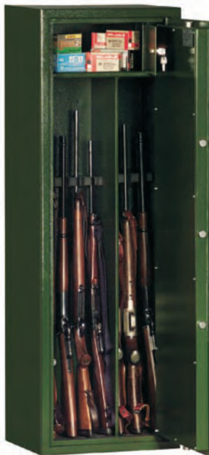
Art. 53601 kompl. m. Waffen

Standardlackierung: RAL 7035 grau bzw. RAL 6020 grün (bitte bei der Bestellung angeben!) Sonderlackierung gegen Aufpreis möglich!