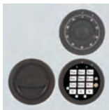
DFS SB Schloß mit mechanischer Revision Art. Nr. 53625

Sonder- Maße u. Ausführungen gegen Mehrpreis lieferbar