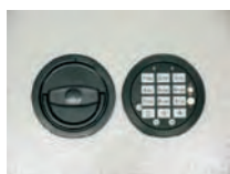
Abb. DFS SB Schloß Art. Nr. 53623