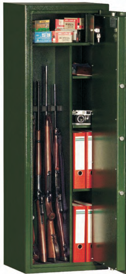
Art. 53601 als Kombischrank (Standard) 4 Waffenhalter, 3 Fachböden 4 Waffenhalter lose zum nachtr. Einbau (s. kleines Foto) serienmäßig.