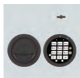
DFS SB Schloß mit mechanischer Revision Art. Nr. 53624