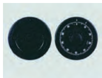
Mechanisches ZK Schloß Art. Nr.: 53522