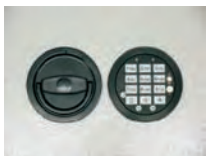
Abb. DFS SB Schloß Art. Nr.: 53523