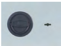
Klappgriff DB Standard