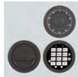
DFS SB Schloß mit mechanischer Revision Art. Nr. 53525

Sonder- Maße u. Ausführungen gg. Mehrpreis lieferbar